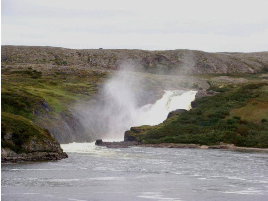
Figure 5. La grandeur des chutes de la Nastapoka.