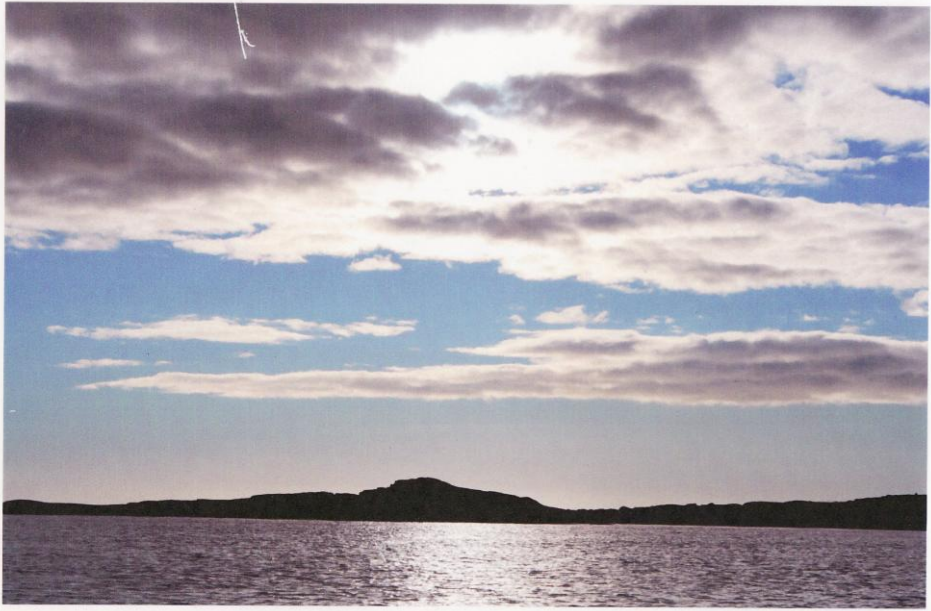
Figure 7. L'importance des ciels et de la lecture des nuages.