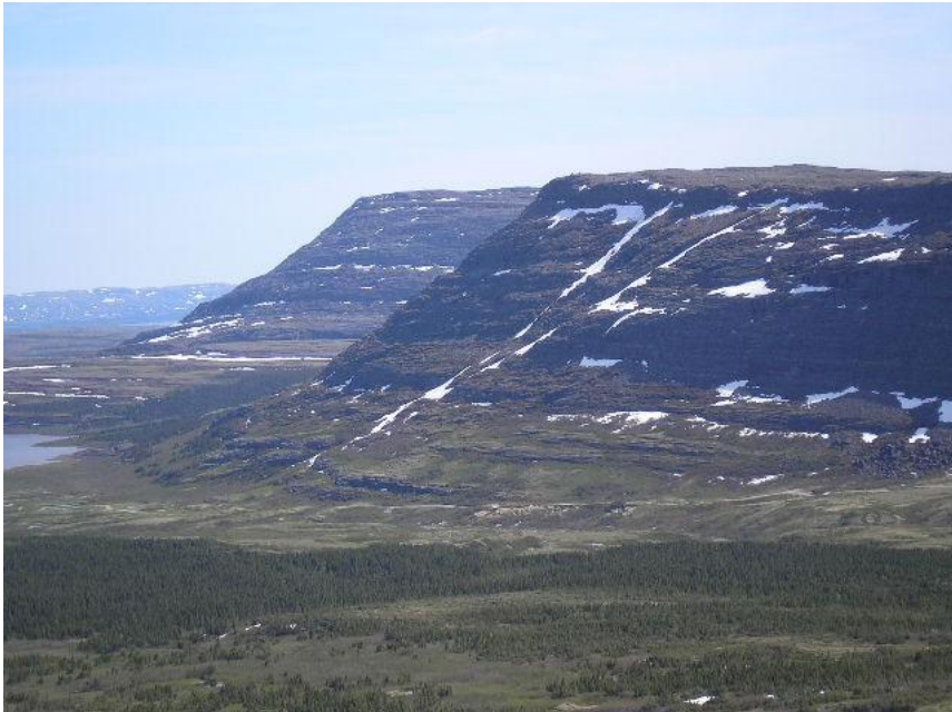
Figure 4. La monumentalité des falaises du lac Guillaume-Delisle.