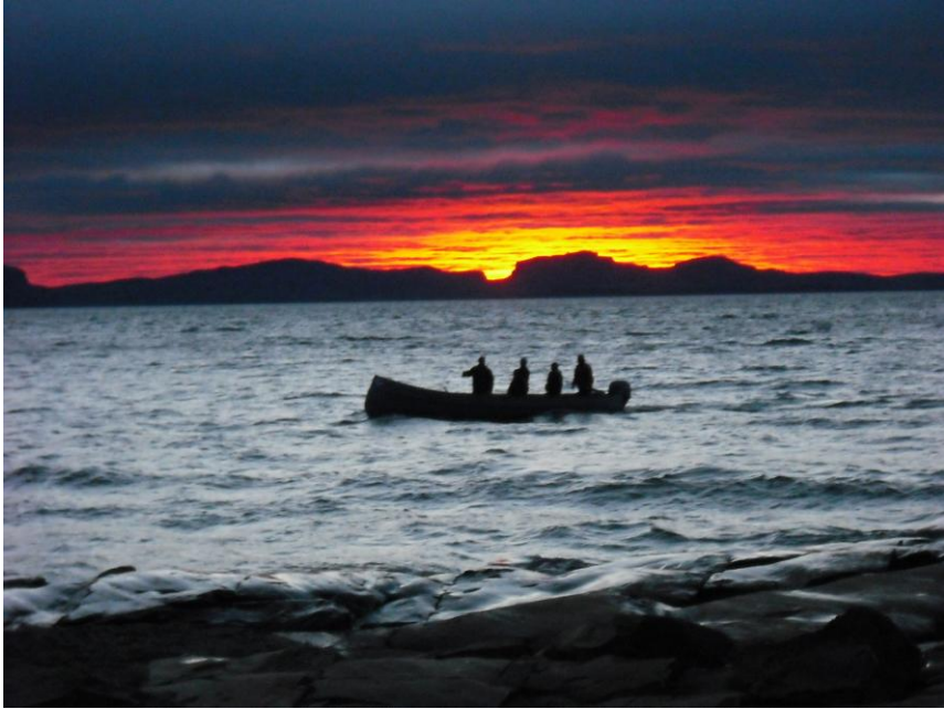
Figure 3. La nature socialisée.