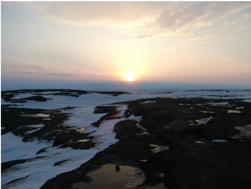
Figure 6. Soleil couchant sur paysage avec premières neiges.