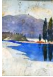
• Photographie d'un tab leau de R. Outh...