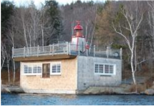
Le dispositif de navigation (hors de la période hivernale où le lac est recouvert de glace)

Puisque le contexte paysager est « naturel » et que l'habitat est inaccessible par route, le décor est ponctué d'ouvrages relatifs à la navigabilité du lac : la marina, un phare et une balise lumineuse, les pontons, ainsi que les garages à bateaux (autre spécificité d'origine anglophone) sont les motifs « aquatiques » du paysage. Ce paysage est donc l'expression d'un portrait de la nature nord-américaine, celui de la grande nature sauvage, assorti du mythe de la cabane au Canada.