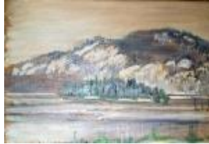
• Photographie d'un tab leau de R. Outh...