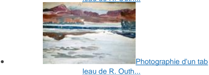
Photographie d'un tab