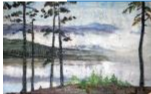
• Photographie d'un tab leau de R. Outh...