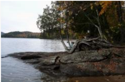
Les motifs de la nature sauvage :

Dans son unité paysagère, trois types de motifs se combinent pour former le patrimoine à la fois naturel et culturel de Lac-Tremblant-Nord.