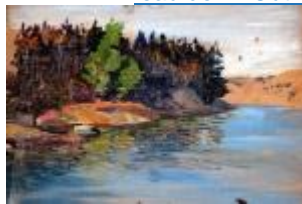
• Photographie d'un tab leau de R. Outh...