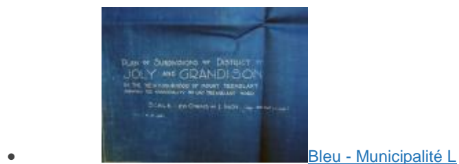
Bleu - Municipalité L