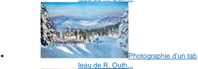
Photographie d'un tab