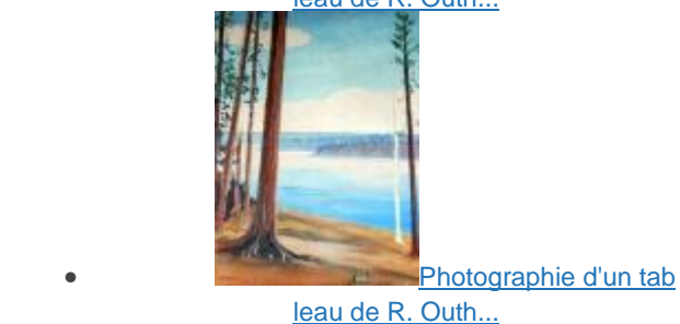
Photographie d'un tab