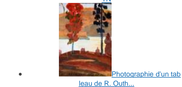
Photographie d'un tab