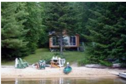
Le motif de la cabane ou du cottage :

Le caractère « sauvage », originel, est fondamental dans l'expression emblématique de ce paysage comme lieu de ressourcement, voire de spiritualité. Ce sont les éléments bruts du paysage qui opèrent cette scénographie involontaire mais tant recherchée, notamment les plages, les roches affleurantes, les racines tortueuses, les découpes géomorphologiques (pointes, baies, îles) ainsi que la limpidité de l'eau.