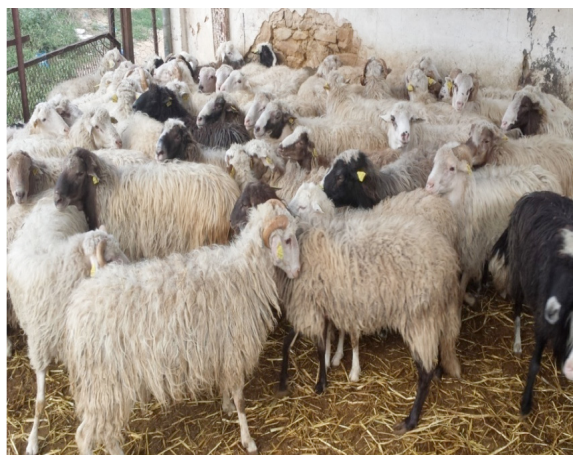
Figure 4. Jeunes béliers de race sicilo-sarde à l'UCPA Methline, Bizerte, Tunisie — Young rams of Sicilo-Sarda breed at UCPA Methline, Bizerte, Tunisia.

les femelles. Les oreilles sont petites et horizontales et le chanfrein est droit. L'encolure est plus ou moins longue. Le tronc est allongé et l'abdomen est ample (Rekik et al., 2005).