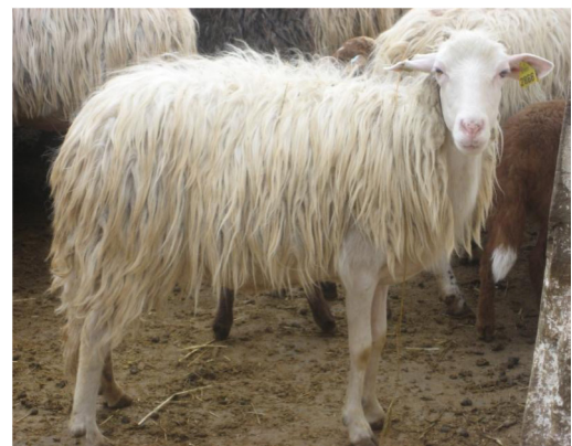
Figure 3. Brebis de race sicilo-sarde — Sicilo-Sarda dairy ewes (Rekik et al., 2005).

Sur le plan de la configuration générale, la race sicilo-sarde est caractérisée par une taille moyenne au garrot variant entre 70 et 80 cm ( Figure 3 ). Le poids moyen de l'adulte est de 45 kg chez la femelle et de 65 à 75 kg chez le mâle. Cette race a une couleur de robe très variable, pouvant être blanche, noire ou tachetée ( Figure 4 ). La forme de la toison est hétérogène et jarreuse. La tête est légèrement allongée. Le profil est droit avec une légère courbure, la queue est fine et longue et les membres sont fins. Les cornes sont de petite taille et plus longues chez les mâles que chez