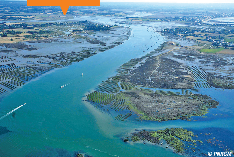
📍 Estuaire de la rivière du Pénerf (Morbihan).