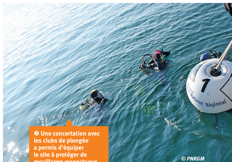
③ Une concertation avec les clubs de plongée a permis d'équiper le site à protéger de mouillages respectueux des fonds marins.

Même si bien d'autres situations ont été étudiées, ces quelques exemples montrent déjà plusieurs choses. Le PNR ou, avant 2014, l'équipe de préfiguration du PNR sont chaque fois en position de traducteurs, du langage et du vécu de certains acteurs vers d'autres acteurs, du réel pour le rendre plus facilement discutable dans des espaces de concertation, des idées issues du dialogue pour les traduire en actions, règles, coordinations. De sa capacité à se positionner comme médiateur, négociateur ou encore pilote de proces-