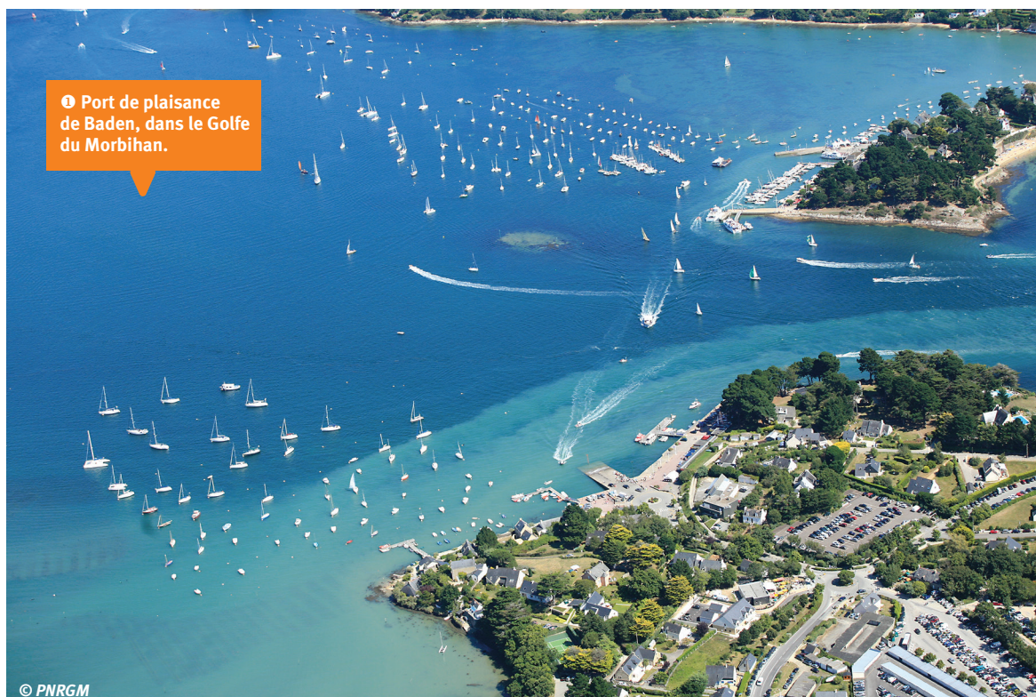
1 Port de plaisance de Baden, dans le Golfe du Morbihan.