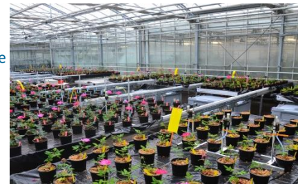
Fig. 1 – Photo du dispositif expérimental