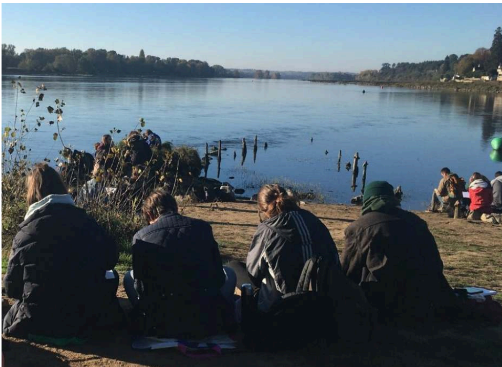
Figure 3. Séance de dessin sur les bords de Loire en phase diagnostic de projet

d'aménagement. L'enseignant est le garant de la fluidité de la démarche de l'amont à l'aval. La relation n'est cependant pas linéaire car un premier diagnostic peut déclencher une intuition de projet qui, une fois testée, nécessitera alors de reprendre l'état des lieux afin de l'approfondir. Itérative, la démarche de projet est parfois contre-intuitive pour l'élève ingénieur plus habitué au schéma linéaire cause-conséquence. En lien avec cette difficulté, une autre est de lui faire dépasser la logique de pensée selon laquelle chaque problème a sa solution : non seulement la démarche de projet de paysage consiste à formuler un problème parmi une multitude d'autres possibles, mais en plus une grande diversité de solutions s'offre au concepteur·trice pour résoudre le problème qu'il·elle a construit... Il s'agit donc de faire des choix, aussi bien dans l'état des lieux que dans les préconisations, mais des choix conscients, avoués et argumentés : par définition, les partis pris ne doivent jamais être implicites.